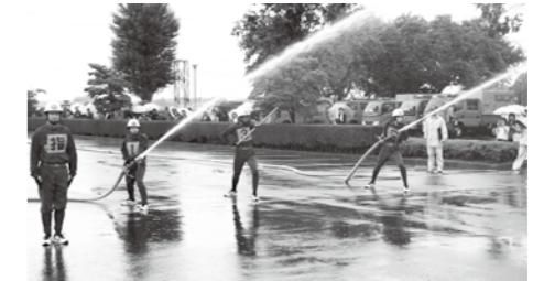
昨年行われた町ポンプ 操法大会の様子

先月号で募集した新コーナーのタイトルについて、たくさんの皆様からご応募をいただき、ありがとうございました。応募作品の審査を行い、消防団員は災害現場で要となる人であることから「要人」と火の「用心」を掛けた「熱いぜ！まちの火の要人」に決定しました。毎月「要人」と消防団の活動などを紹介していきますので、新コーナーをよろしくお祈りします！