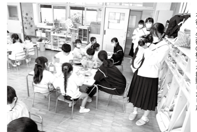
取材の一環で、鏡石幼稚園で職場体験を行う生徒の様子を撮影しました！

3人は記事の書き方やカメラの使い方について町の広報担当者から説明を受けた後、町内の事業所で取材を行い、実際に写真を撮影したり記事を書くなどして広報紙を作るための一連の作業を体験しました。