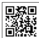
確定申告書等作成コーナー