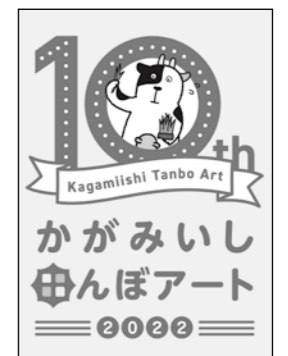
田んぼアート10周年を記念して作成したロゴ