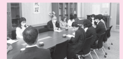
第一小学校での委員会の様子

今年度は「早寝・早起き・朝ごはん運動」や、健康教育の推進、委員会便りの発行などを通じて活動や情報の発信を行っていきます。子どもたちの健康や発達等に不安がある方はお気軽に所属施設や健康環境課までご相談ください。