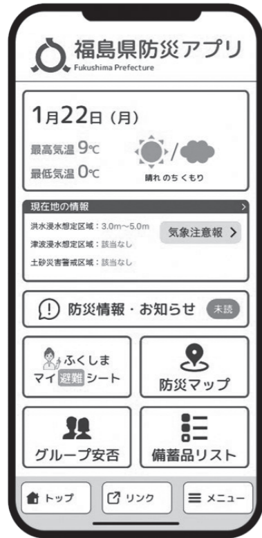
*アプリの画面イメージ

県では、様々な災害情報や防災情報を簡単に入手できるように防災アプリの制作、ポータルサイトを公開しました。これらを上手に活用して、日頃から災害に備え、災害発生時には、迅速な避難行動に繋がしましょう。