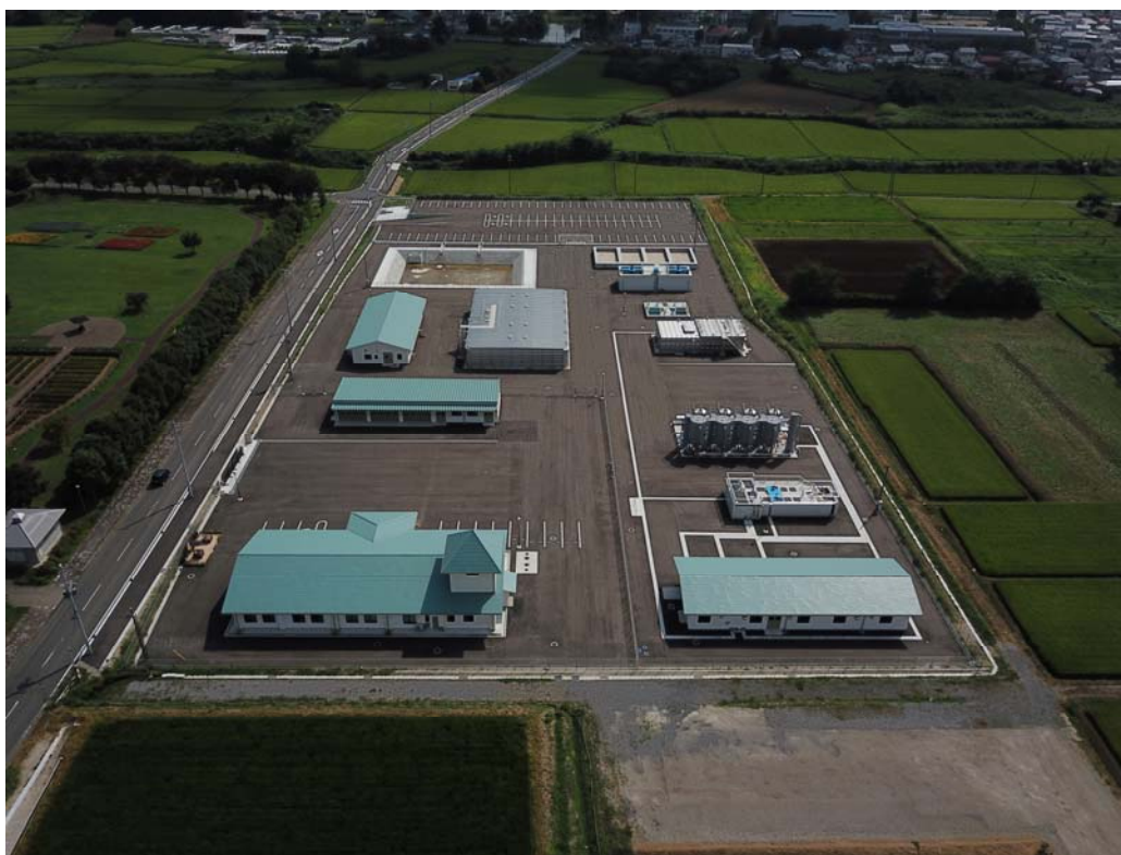
鏡石浄水場 令和4年9月30日完成

水質検査は、水道水が水質基準に適合し、安全であることを保障するために不可欠であり、水質管理を行う基本となるもので水道事業者に義務付けされているものです。その水質検査の適正化を確保するために、水質検査項目等を定めたものが水質検査計画書です。